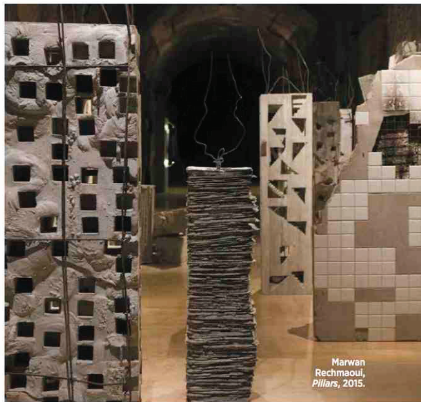
Marwan Rechmaoui, Pillars , 2015.